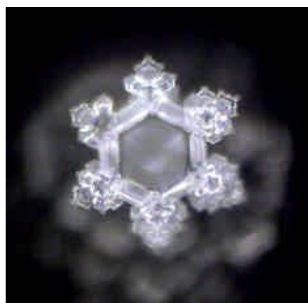
Wasser nach der Aqua-Lith Patrone Das Sechseck und die Zahl sechs: