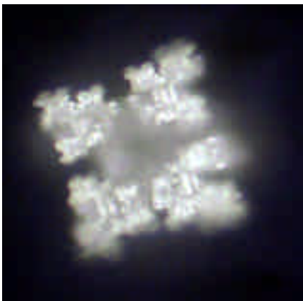
Mein Brunnenwasser vorher. Charakteristisch für volles Wasser ist die viereckige Geometrie.