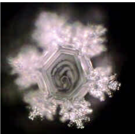
Wasser nach der Aqua-Lith Patrone Das Wasser bildet sechseckige Formen.