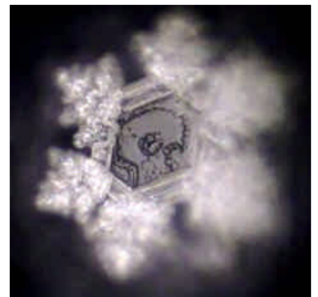
Wasser nach der Aqua-Lith Patrone LIEBEVOLLE ACHTSAMKEIT