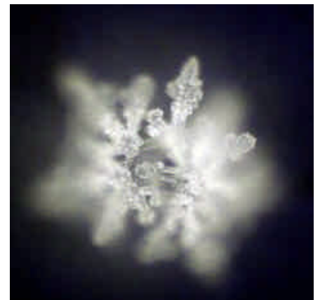
Wasser nach der Membran und vor der Aqua-Lith Patrone. Es erstaunt die Energieausstrahlung.