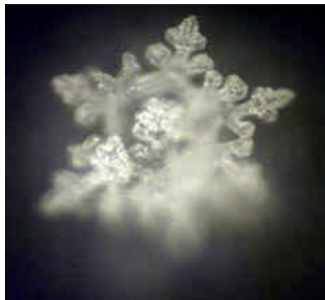
Wasser nach der Membran und vor der Aqua-Lith Patrone. Es erstaunt die Energieausstrahlung.